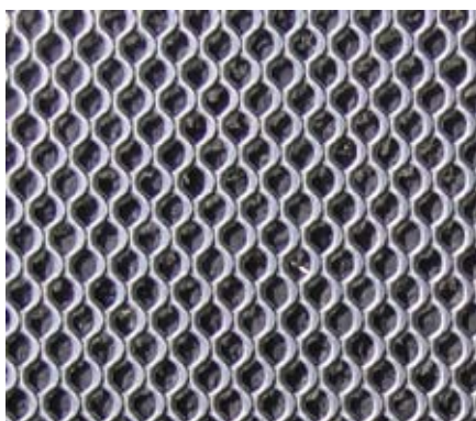
Streckmetall glatt recostal® 1000/glatt Fugenkategorie „rauh“