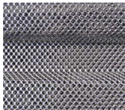
Streckmetall profiliert recostal® 1000/profiliert Fugenkategorie „verzahnt“